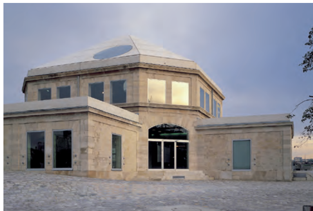
Maison de la Villette Vue extérieure / Exterior view

The Maison de la Villette also claims this popular qualification, but rather in terms of the concept of people's memories. While its two big neighbors host events, the purpose of the Maison de la Villette is mostly to revive: the cultural project being to welcome the memories of the neighborhood's past, signs of which have almost completely disappeared from the old slaughterhouse neighborhood. In the neighborhood of la Villette, life was organized around the working community that enjoyed little leisure time. When the slaughterhouse closed and there was no more work, the community faded away. Afterwards, when the amount of time devoted to leisure and alongside individualism increased