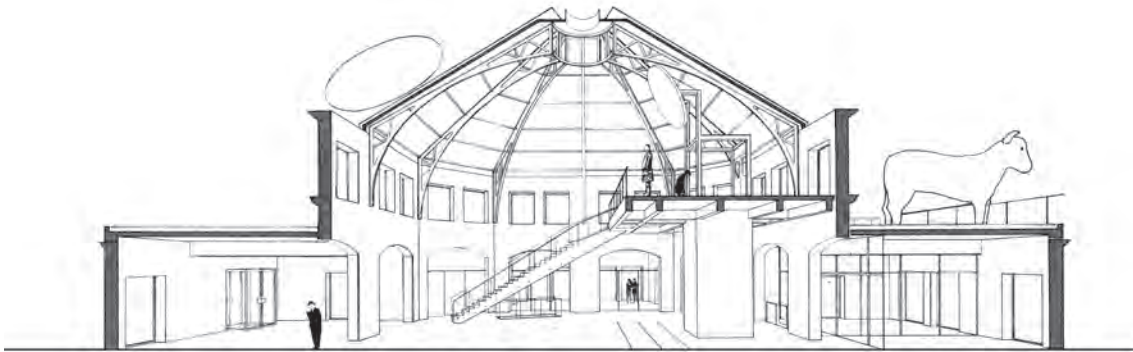
Maison de la Villette Coupe / Section

significantly, the memories of this society - considered organic - began to fuel our nostalgia. At a time when individuality and the everlasting present rule, we miss that united world that has become so distant that it was decided that go-betweens were needed to revive it. Therefore, the Maison de la Villette's team had the noble yet sad task of calling up that vanished vitality. It was up to them to instruct our social state and be a source of inspiration for the current neighborhood, which is still working-class indeed but lacking any real consciousness or clear representation of itself.