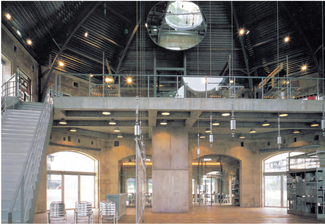
Maison de la Villette Vue intérieure / Interior view

chez elle de la réanimation, son projet culturel consistant à convoquer en ses murs la mémoire populaire, quasiment disparue de l'ancien quartier des abattoirs. À la Villette, la vie s'organisait autour d'une communauté de travail qui disposait de peu de loisirs. Les abattoirs ayant fermé, le travail ayant cessé, la communauté s'est dissoute. Ensuite, le temps consacré aux loisirs ayant augmenté significativement et avec lui l'individualisme, le souvenir de cette société, considérée comme « organique », a commencé d'alimenter notre nostalgie. À l'heure de l'individu roi et du présent perpétuel, ce monde soudé nous manque et nous est étranger au point qu'il a été décidé que nous avons besoin de médiateurs pour le réanimer. Les animateurs de la Maison de la Villette avaient donc pour tâche noble et triste de convoquer cette vitalité disparue. À charge pour eux d'instruire notre état social et d'inspirer la vie du quartier actuel, encore populaire certes, mais sans véritable conscience ni représentation claire de lui-même.