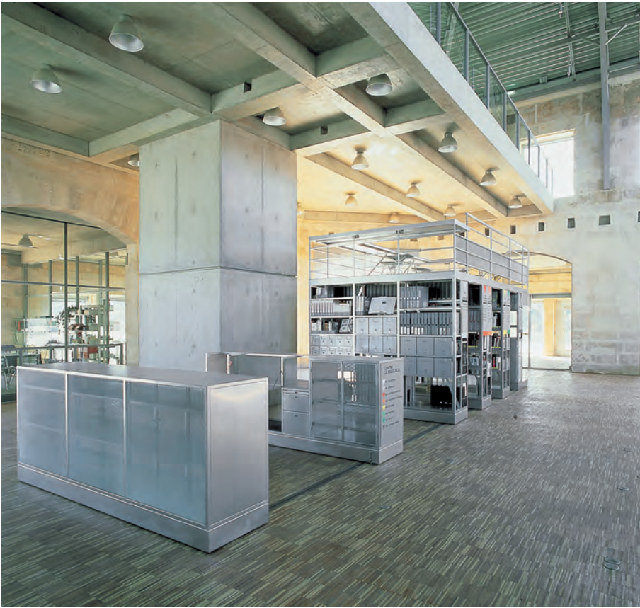
Maison de la Villette Centre de documentation / Documentation center

motors, pulleys, cables and rails in motion to animate the exhibition devices and the documentation center. Is a party thrown for an exhibit? During that time span, by hitting a few buttons, the exhibit disappears above and the documentation center goes into hiding: the space is now free for visitors to take over - if they want to do so (that's the problem). They do this under the gaze of a large round mirror hung above that reflects the part of the Villette neighborhood that has remained industrious through a wide opening in the roof.