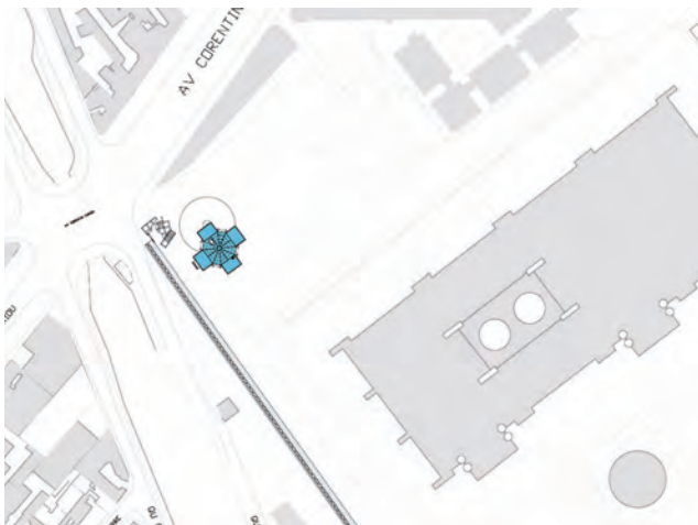
Maison de la Villette Plan masse / Site plan

La Maison de la Villette revendique aussi le qualificatif de populaire, mais en s'appuyant principalement sur le concept de mémoire populaire. Ce qui relève de l'animation chez ses grands voisins procédera