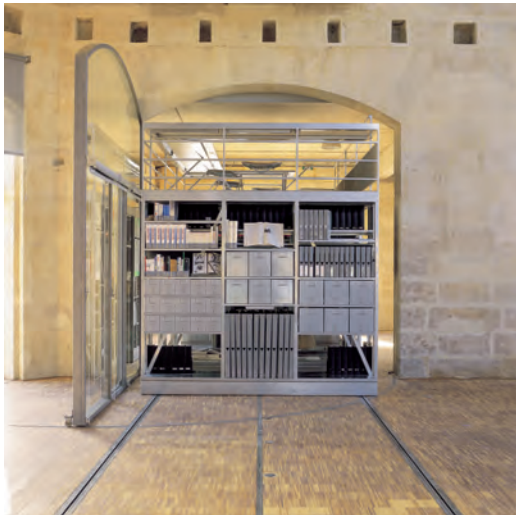
Maison de la Villette Centre de documentation / Documentation center

s'entendait comme « remettre en vie » : par la restitution du mouvement et de la mémoire. Par la convocation d'un corps et d'un esprit.