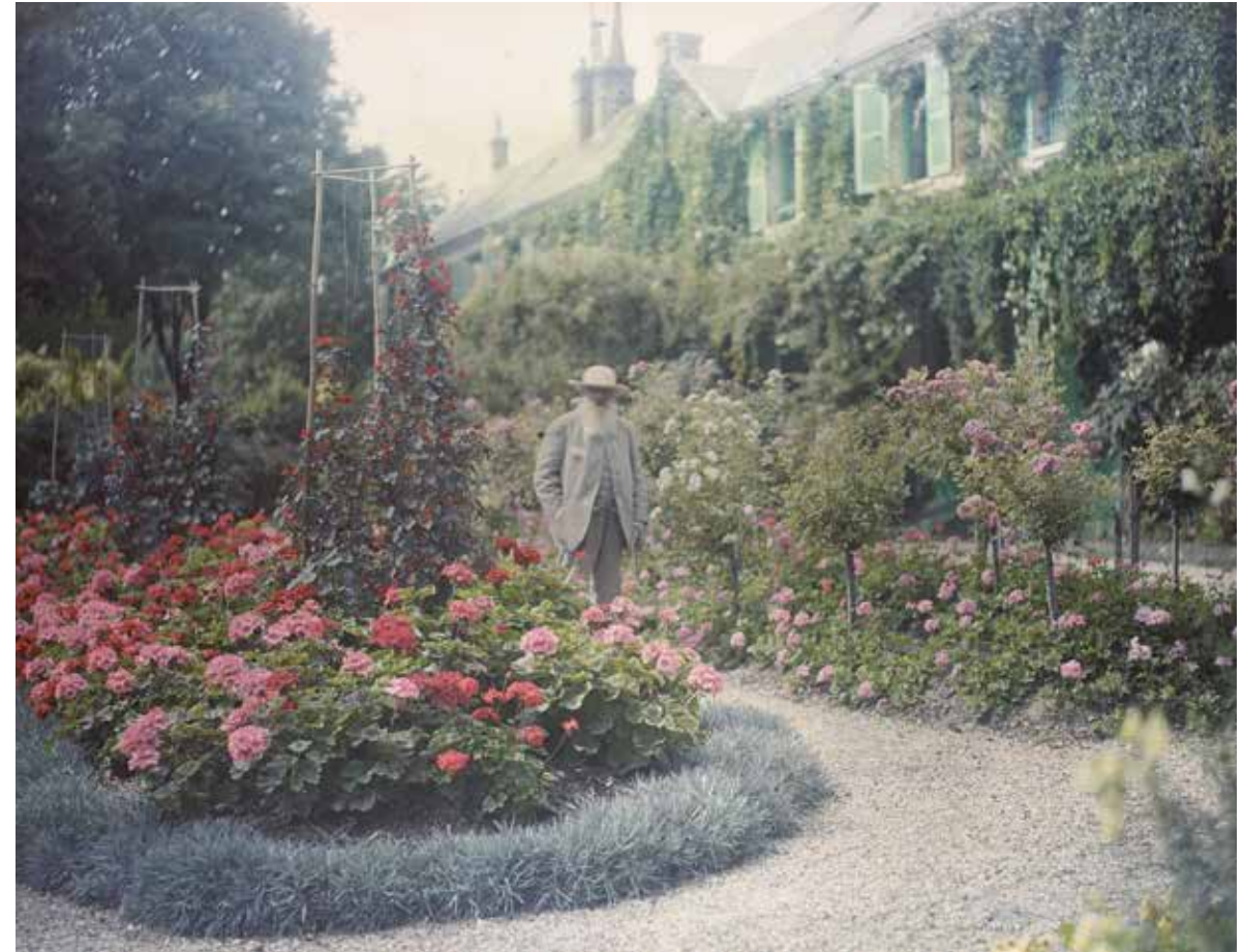
Claude Monet devant son jardin à Giverny, 1921

As a complete contrast to Gray’s landscape description, let us look at an episode (dated 21 August 1940) from the French poet Francis Ponge’s Le Carnet du Bois de Pins . To single out an extract like this is perhaps to falsify Ponge’s method, which is designedly one of preparing a poetic approach to the pine wood over a series of journal entries, cumulative in their effect. Not for Ponge the panoramic view from a commanding height! But in spite of this reservation, the passage quoted here marks a sufficient contrast to the technique of Gray: “ Let us speak simply: when you penetrate into a pine wood, in summer during the period of great heat, the pleasure that you feel is very similar to that which would be offered by the little dressing room next to the bathroom of a wild but noble creature. Odour-bearing brushes in an overheated atmosphere and in steam which mounts from the bath-tub of lake or sea. Skies like fragments of mirrors beyond the brushes with their long fine handles all engraved with lichen. Smell, unique of its kind, of hair, of its combs and pins. Natural transpiration and hygienic perfumes mixed together. Left on the top of the dressing table, big ornamental stones here and there, and in the vaults this animal crackling, this million animal sparks, this musical and song-like vibrancy.” 16