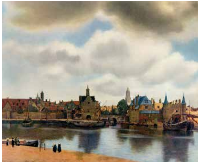
Johannes Vermeer, Vue de Delft , 1659-1660