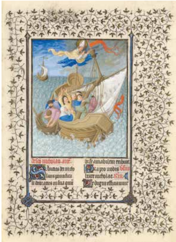
Les Riches Heures du duc de Berry, Folio 168, 1405-1409