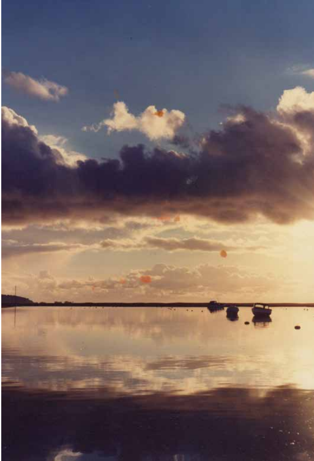
Chris Welsby, Sanctuary (extrait), 1980