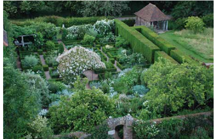
Jardins du château de Sissinghurst, vue générale