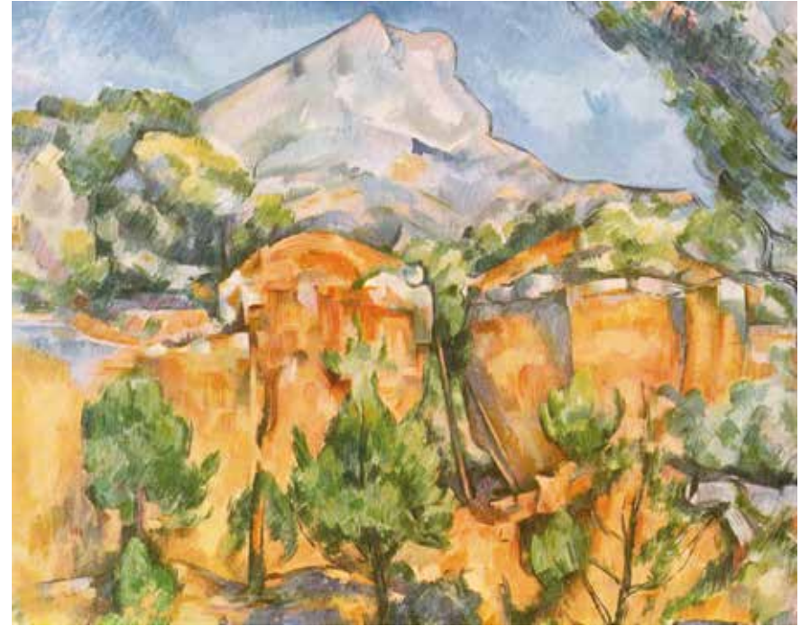
Paul Cézanne, Paysage rocheux , 1870