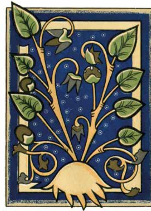
Botanique du XIII e siècle (illustré dans Modern Painters , John Ruskin, 1843-1860)